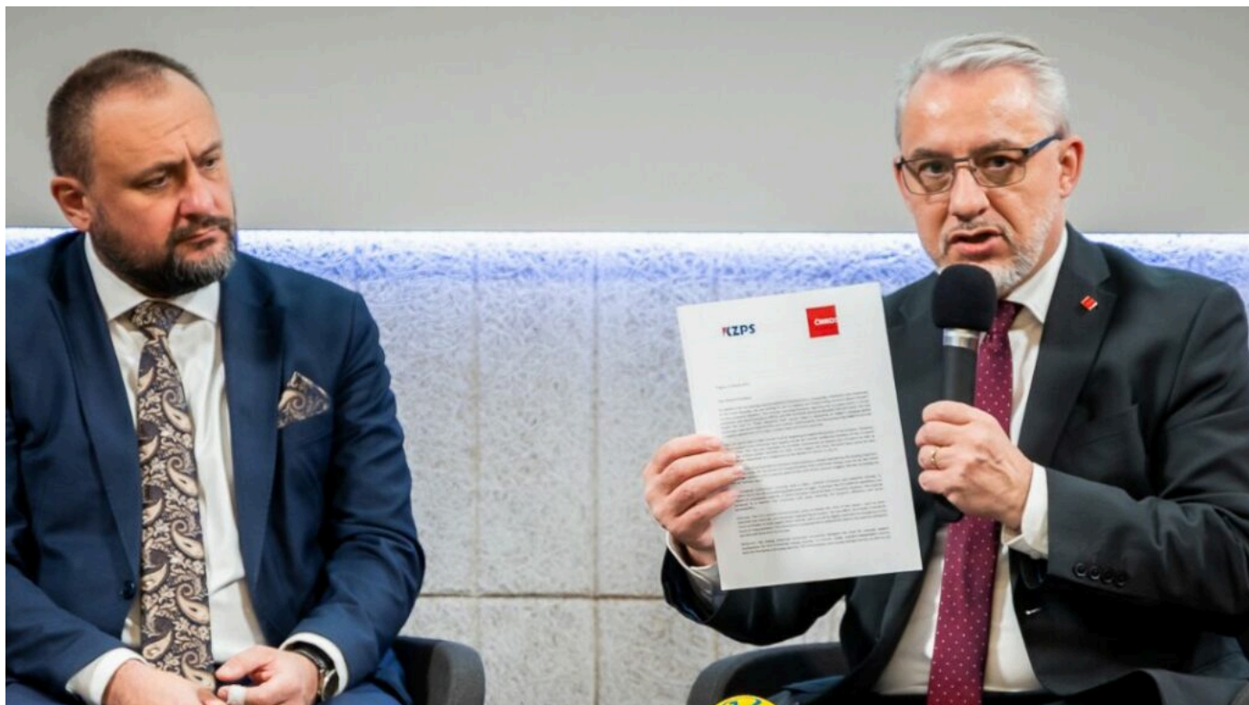
Otevřený dopis Ursule von der Leyen, předsedkyně Evropské komise, upozorňuje, že současná cesta povede k masivní nezaměstnanosti a ekonomickému propadu EU.

Snížení emisí CO 2 o 90 % do roku 2040 je nejen nerealistické, ale přímo nebezpečné. Neexistují totiž konkrétní opatření, jak těchto ambiciózních cílů dosáhnout, aniž by to vedlo k masivnímu úpadku průmyslu. Josef Středula, předseda ČMKOS, varuje: „Evropská komise opět ignoruje realitu. Místo strategické podpory firem přináší jen další regulace, které zvýší náklady podniků a ohrozí miliony pracovních míst.“