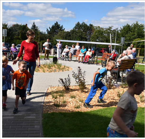
Autor: L. Kolářová