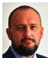
Jiří Horecký prezident Unie zaměstnavatelských svazů ČR