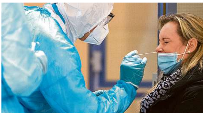
Mobilní odběrové týmy by zvýšily zájem o antigenní testy. Jeden takový otestoval na konci minulého týdne v Třeboni šest desítek pedagogických pracovníků.

Velká část ředitelů navíc v odpovědích na dotazy LN zmiňuje, že jistá část, většinou je to mezi pětinou až čtvrtinou pedagogů, sboru už covid prodělala. Jenže to ani zdaleka neznamená, že jsou vůči nákaze imunní, tím spíše ti, kdo se nakazili ještě na jaře. „Podle dosavadních znalostí se ukazuje, že imunita, tedy ochrana po prodělaném onemocnění covidem, nemusí být dlouhodobá a může trvat jen několik měsíců. Již za 85 dnů u většiny osob klesají hladiny protilátek