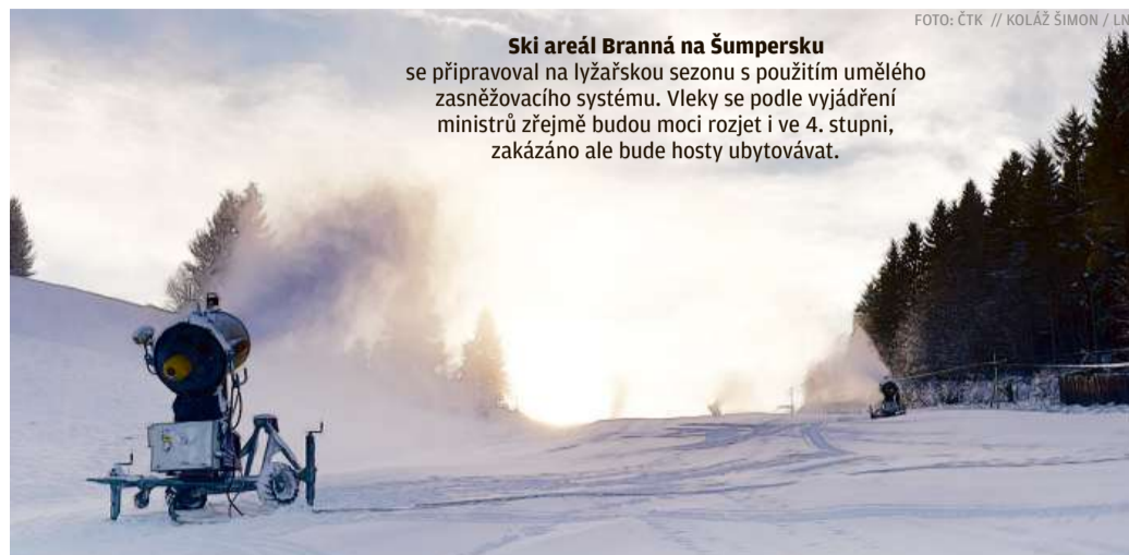
Ski areál Branná na Šumpersku se připravoval na lyžařskou sezonu s použitím umělého zasnežovacího systému. Vleky se podle vyjádření ministrů zřejmě budou moci rozjet i ve 4. stupni, zakázáno ale bude hosty ubytovávat.