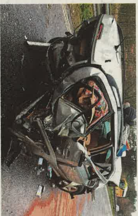
Tragédie na D10 Auto, v němž po kolizi s vyhržujícím řidičem utrpěli zranění čtyř lidí. Osminměsíční kojeneček, jím nakročen podleh.